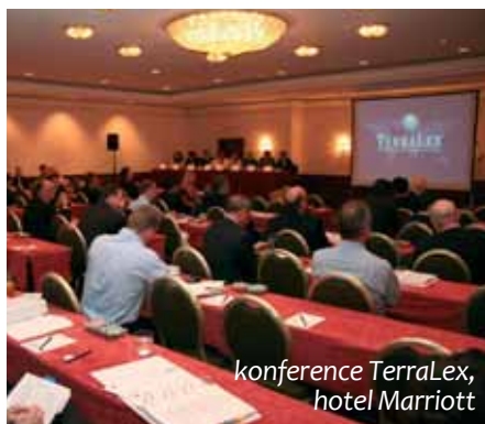
konference TerraLex, hotel Marriott

V případě (systému) obchodu a (jednoho z jeho prvků či součástí) cestovního ruchu je