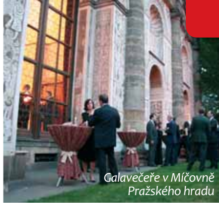
Galavečeře v Míčovně Pražského hradu

patří k největším českým společnostem působícím v oblasti kongresové turistiky. Je dlouhodobým partnerem Univerzity Karlovy a Národní galerie v Praze – Veletržního paláce. Loni oslavila 15 let na trhu. Je členem International Congress & Convention Association (ICCA), jež působí ve více než osmdesáti zemích světa a European Federation of Associations of Professional Congress Organizers (EFAPCO). Mezi její stěžejní činnosti patří kongresová a incentivní turistika, pořádání firemních a společenských akcí, a ve spolupráci se sesterskou společností AC EXPO pak organizace výstav a veletrhů včetně ubytovacích služeb. Odbornost a profesionalitu zajišťuje kvalitní tým odborných pracovníků a prověřené desítky subdodavatelů, což Agentuře Carolina umožňuje pružně reagovat i na vysoce specifická přání klientů.