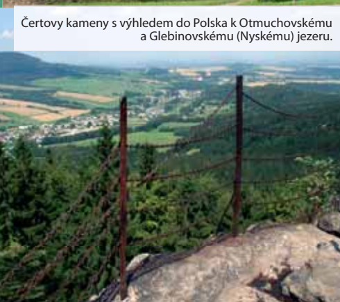
Čertovy kameny s výhledem do Polska k Otmuchovskému a Glebinovskému (Nyskému) jezeru.