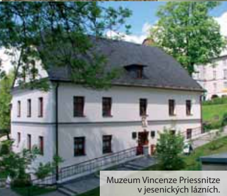
Muzeum Vincenze Priessnitze v jeseníckých lázních.