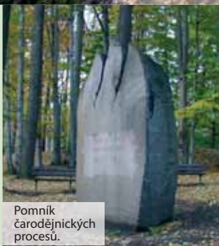
Pomník čarodějnických procesů.