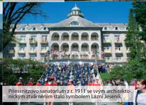
Priessnitzovo sanatorium z r. 1911 se svým architektonickým ztvárněním stalo symbolem Lázní Jeseník.