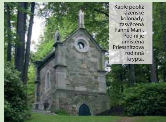
Kaple poblíž lázeňské kolonády, zasvěcená Panně Marii. Pod ní je umístěna Priessnitzova rodinná krypta.