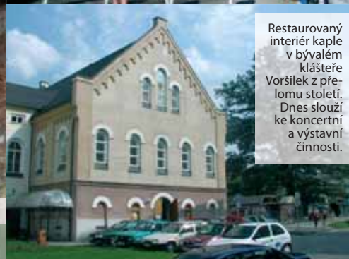
Restaurovaný interiér kaple v bývalém klášteře Voršilek z přelomu století. Dnes slouží ke koncertní a výstavní činnosti.