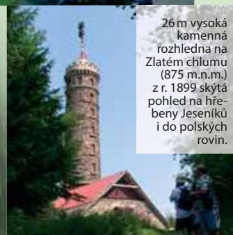
26 m vysoká kamenná rozhledna na Zlatém chlumu (875 m.n.m.) z r. 1899 skýtá pohled na hřebeny Jeseníků i do polských rovin.