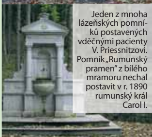
Jeden z mnoha lázeňských pomníků postavených vděčnými pacienty V. Priessnitzovi. Pomník „Rumunský pramen“ z bílého mramoru nechal postavit v r. 1890 rumunský král Carol I.