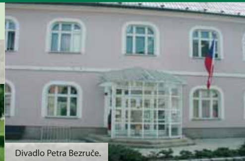
Divadlo Petra Bezruč.