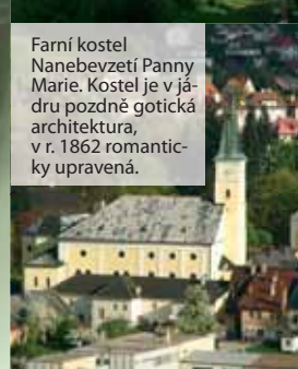
Farní kostel Nanebevzetí Panny Marie. Kostel je v jádru pozdně gotická architektura, v r. 1862 romanticky upravená.