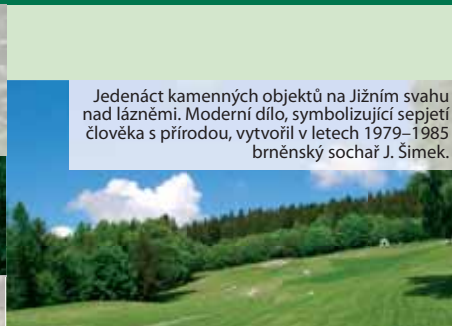
Jedenáct kamenných objektů na Jižním svahu nad lázněmi. Moderní dílo, symbolizující sepjetí člověka s přírodou, vytvořil v letech 1979–1985 brněnský sochař J. Šimek.