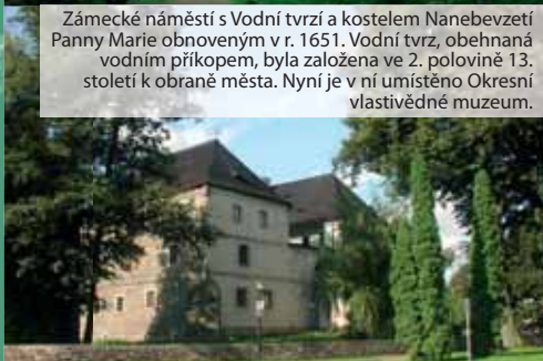
Zámecké náměstí s Vodní tvrzí a kostelem Nanebevzetí Panny Marie obnoveným v r. 1651. Vodní tvrz, obehnaná vodním příkopem, byla založena ve 2. polovině 13. století k obraně města. Nyní je v ní umístěno Okresní vlastivědné muzeum.