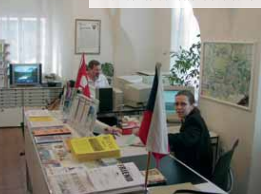
Informační centrum Jesenícka na radnici