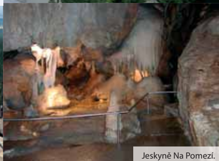
Jeskyně Na Pomezí.