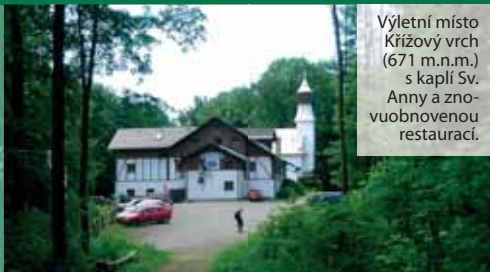
Výletní místo Křížový vrch (671 m.n.m.) s kaplí Sv. Anny a zno-voobnovenou restaurací.