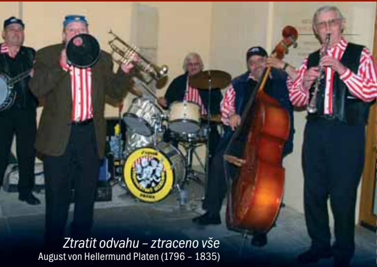
Ztratit odvahu – ztraceno vše August von Hellermund Platen (1796 – 1835)