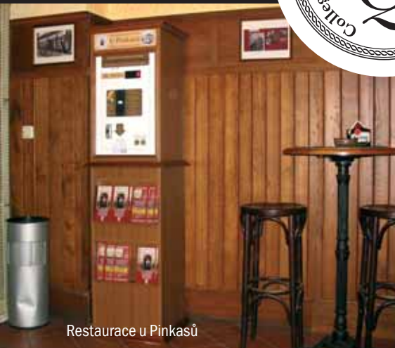
Restaurace u Pinkasů