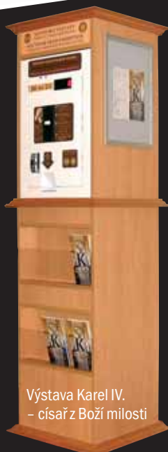
Výstava Karel IV. – císař z Boží milosti

Také pamětní mince se dají dělat s portréty, např. i jako lehce recesistický dar k životnímu jubileu. Jsou ale i další motivace, proč na minci uplatňovat podobizny. Nyní např. pro zámek Zbiroh razíme mince s portréty tří císařů, protože tam v průběhu historie tři císaři - Karel IV., jeho bratr Zikmund Lucemburský a Habsburk Rudolf II. - opravdu pobývali. Nicméně, základ je vždy v nápadu, co na minci. Náš mincovní automat na Pražském hradě např. vydává pamětní mince, vážící se ke katedrále. U hotelů a restaurací pak zpravidla převládají jejich loga doplněná o letopočty. Letopočty totiž minci dělají atraktivnější. Důležité tedy je mít vhodné logo, protože