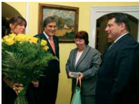
Gala Dinner organizovaný pro velvyslance Chile, pana Carlose Klammera za čestné účasti pana premiéra Jiřího Paroubka

je označit za sommeliery. Pro mne je vždy zajímavé vyprávět zákazníkům příběh vína. Kde se rodí, kdo jej vyrábí, proč zrovna tuhle odrůdu atd. Naše firma je specializovaná na menší a malé vinaře. Tito producenti zpravidla nedisponují reprezentativními katalogy, a zákazník proto mohou a musí přesvědčovat výhradně kvalitou vín. A také tím, kdo za výsledným produktem stojí. To je pro nás zajímavější než pracovat s velkými jmény. Malí vinaři mají daleko větší šanci dát víno jedinečnou zajímavou chuť. Když vezmu v potaz např. chilská vína, která jsou produkována průmyslově, jsou co