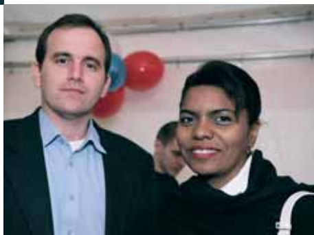
„Wines of Chile“ – klient Chilská ambasáda

Spousta Čechů stále nakupuje podle n8lepkz