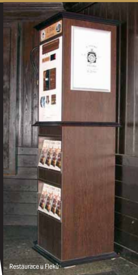
Restaurace u Fleků

i když jsou podniky, které jsou svými službami hodně zajímavé, mohou mít logo, které se na minci nehodí. Pak je otázkou, zda logo upravit, a nebo si vzájemně říci, že mince realizovat nebudeme. Na minci se opravdu nedá dát cokoliv. To je její nevýhoda. Pokud se shodneme na motivu, co na minci, nechám vypracovat a předložím grafický návrh. V momentě, kdy je zákazníkem vzhled mince – revers i avers – schválen, nainstalujeme během tří čtyř týdnů mincovní automat stylově přizpůsobený interiéru s hotovými pamětními mincemi v zásobníku. A může se prodávat. Další výhoda mincí (když pominu automat) je, že jsme je schopni zlatit a popřípadě je nechat razit z ušlechtilých kovů. Např. ze stříbra či zlata. K těm pak zpravidla dodáváme dřevěné nebo