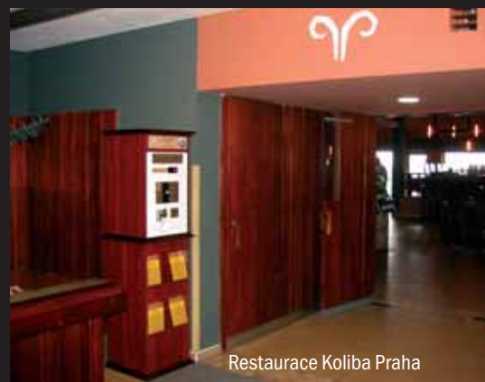
Restaurace Koliba Praha