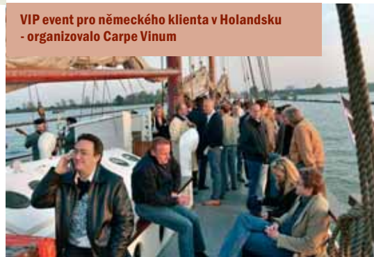
VIP event pro německého klienta v Holandsku - organizovalo Carpe Vinum

je to nový nebo už použitý sud, ačkoliv to všechno spolu souvisí a hlavně to souvisí s kvalitou vína. Čeští zákazníci se mne na takovéto věci často na seminářích ptají.