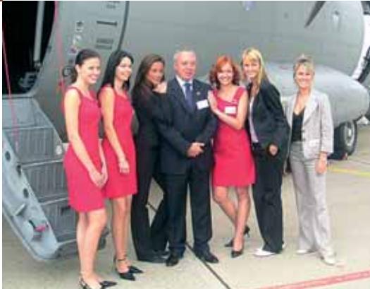
CIAF Brno Air Show – Organizace VIP lounge pro italskou firmu Alenia Aeronautica

Češi mají vysokou kulturu pití vína. Ochutnávají nejen vína, která znají, ale rádi objevují nová a s nimi nové chutě. Trend posledních let napovídá, že se i v pití vín vydali cestou kvality, že jsou ochotni za ni platit. Souvisí to i s tím, že na českém trhu je daleko více možností a nabídek. Sílí poptávka po nových produktech, a víno je in. Já se specializuji na španělská vína, Cabernet Sauvignon, Sauvignon Blau, Verdejo, speciální odrůdy z malých oblastí, jako jsou Macabeo atd. V současné době se rozmáhá poptávka po různých vínech. Daleko více se tu začala pít i sladší