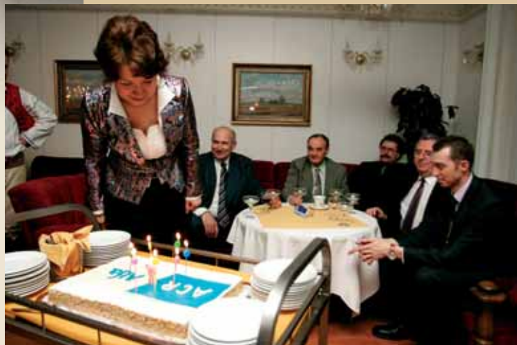
ACR Alfa oslavila sedmé narozeniny společnosti se všemi příznivci i přáteli dortem a přípitkem.