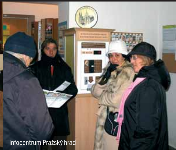
Infocentrum Pražský hrad