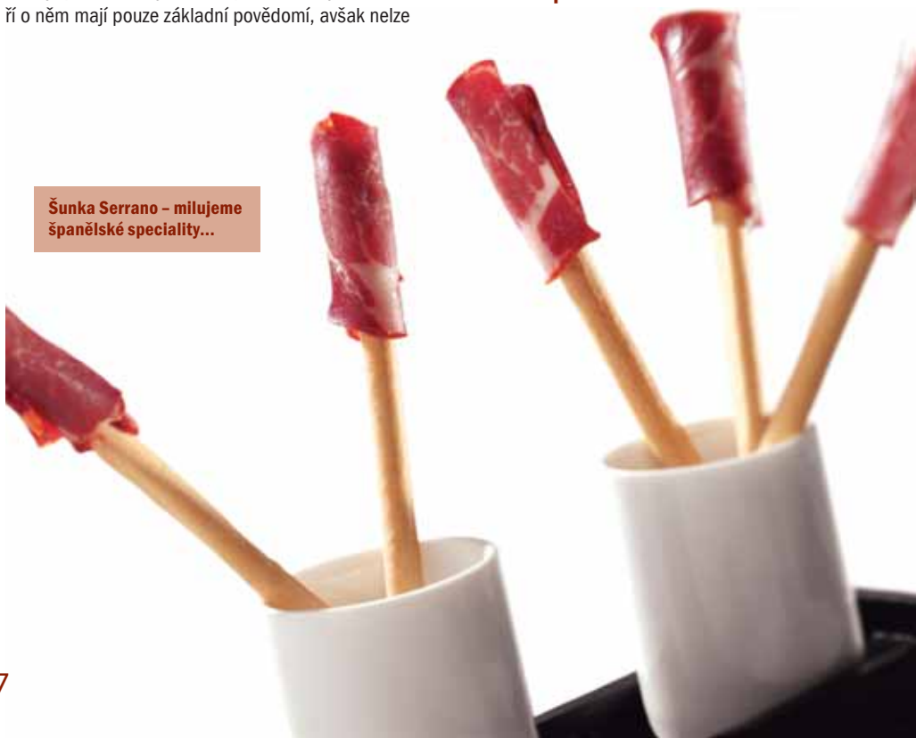
Šunka Serrano – milujeme španělské speciality...

na lahvi – etikety, i když příliš nerozpoznává, co je jejím prostřednictvím sdělováno a co je uvnitř láhve. Mám tu zkušenost, že si řada lidí koupí láhev vína jenom proto, že je na ní napsáno: „rezerva“. U chilského vína to ale např. znamená, že je dva-