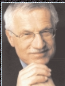
Prof. Václav Klaus

Ve dnech 13. až 18. října se pod záštitou prezidenta České republiky profesora Václava Klause konal IX. mezinárodní jazzový festival „Jazz Goes To Town Hradec Králové“. Do Hradce jsem se těšil z mnoha důvodů. Kvůli atmosféře města, jazzu, přátelům a také kvůli možnosti pohovořit v pátek večer s prezidentem Václavem Klausem.