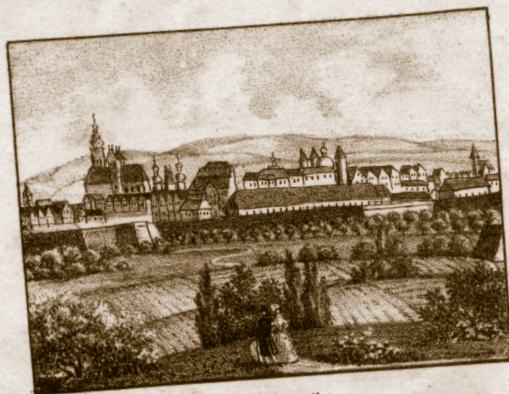
Königgrätz, im Königgrätzer Kreis.

Galerie moderního umění v Hradci Králové Výstava z tvorby významných českých výtvarných umělců, kteří se v Hradci Králové narodili, studovali nebo tu zanechali některé ze svých významných děl (např. Bohumil Kubišta, Jan Preisler, Vincenc Beneš, Václav Špála, Josef Šíma, Jindřich Štyrský a řada dalších).